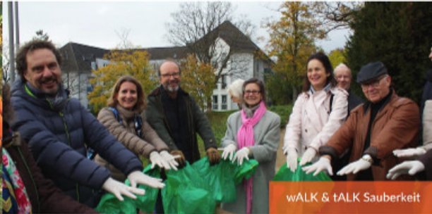
wALK & tALK Sauberkeit