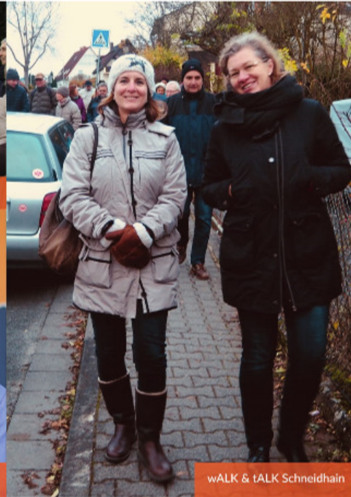
wALK & tALK Schneidhain